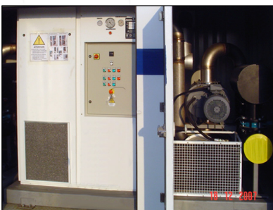
UV16 H con roots booster

El proyecto fue dirigido por un equipo de trabajo entre varias oficinas de ingenierías, una colaboración de ingenieros de Australia, Dubai, Italia, EEUU y India. Los provechos de esta solución de vacío para secar son evidentes, puesto que los camiones pueden ser desplazados con facilidad, solo necesitan energía eléctrica gracias a generadores, ningún agua de recirculation, ningún alto costo de inversión como tal vez pasa por grandes compresores combinados con varios secadores, no alto costos operativos debido a un bajo consumo energético. También tamaño y peso influyen en la fácil gestión de ese camiones listos para ser utilizados.